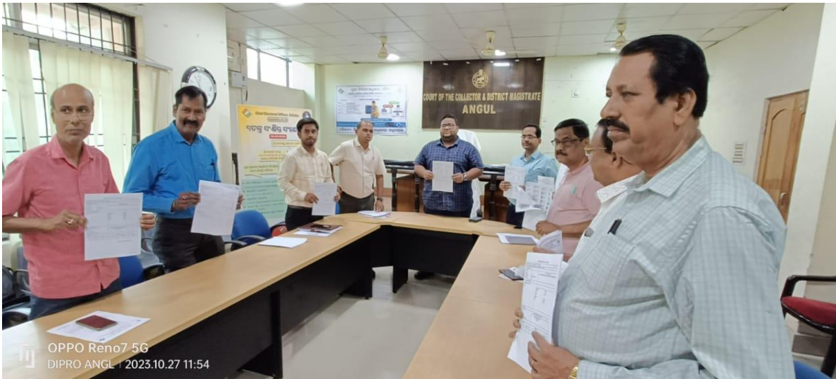
OPPO Reno7 5G DIPRO ANGL | 2023.10.27 11:54