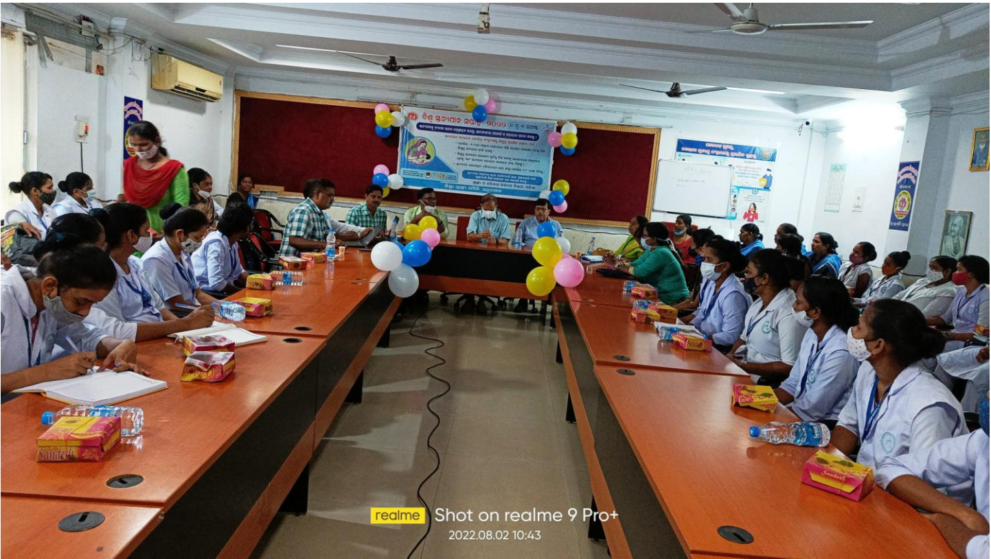
realme Shot on realme 9 Pro+